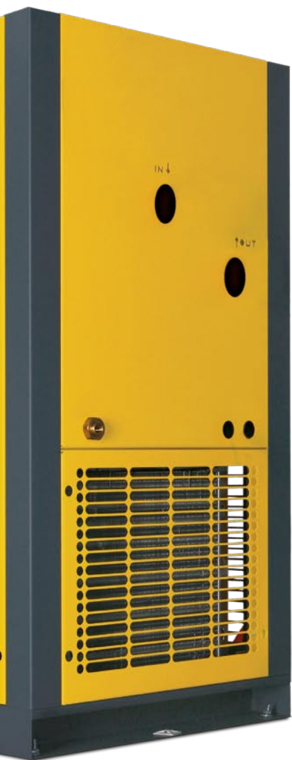
Modello base THP 40-50